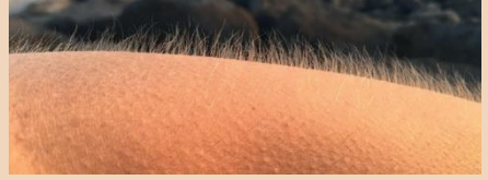
Çok soğuk cilt