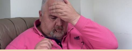
Şiddetli baş ağrısı

Eğer bir enfeksiyonunuz varsa ve aşağıdaki semptomlardan herhangi biri geliyorsa derhal bir doktora görünmelisiniz. Aile Hekiminizi, NHS 111'i, NHS Galler Direk Hattını ya da NHS 24'ü arayın.