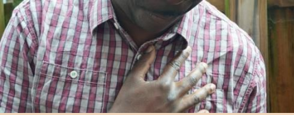
Göğüs kafesinde ağrı