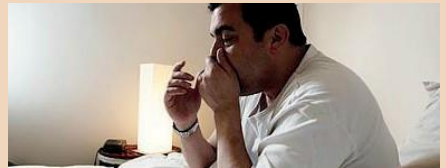
Çok daha kötü hissetme