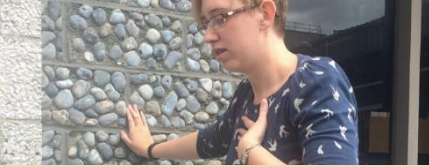
Nefes almada güçlük