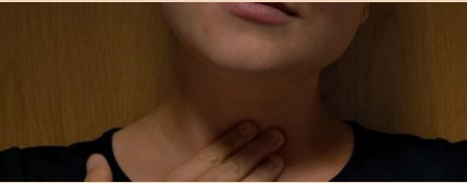
نگلنے میں مسائل