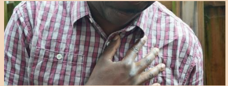
چھاتی میں درد