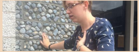
سانس لینے میں مشکل