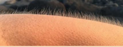
بہت سرد جلد

اگر آپ کو عفونت ہو گئی ہے اور ذیل میں دی گئی علامات مرض میں سے کوئی بھی پیدا ہوتی ہے، تو آپ کا فوری طور پر ایک معالج کے ذریعے معاندہ ہونا چاہئے۔ اپنی جی پی پریکٹس کو فون کریں یا این ایچ ایس 111، این ایچ ایس ڈائریکٹ ویلز یا این ایچ ایس 24 کو کال کریں۔