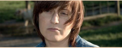
الجھن محسوس کرنا