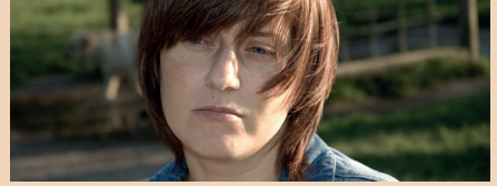
भ्रमित महसूस करना