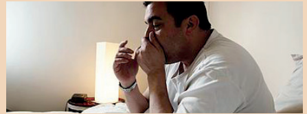
बहुत बुरा महसूस करना