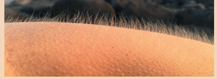
बहुत ठंडी त्वचा