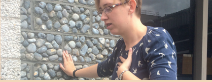
साँस लेने में कठिनाई