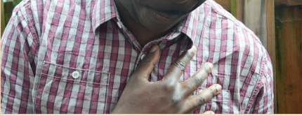
छाती में दर्द