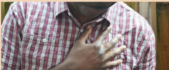
Poen yn y frest