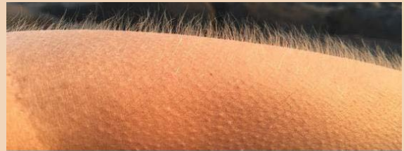
Croen oer iawn