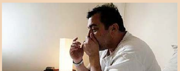
Teimlo'n llawer gwaeth

Os oes gennych COVID-19 ac rydych yn dechrau teimlo'n waeth, gan gynnwys dangos yr arwyddion uchod, gofynnwch am gymorth meddygol ar unwaith gan GIG 111 (ffoniwch 111 neu ewch i https://111.wales.nhs.uk/coronavirus(2019ncov) )