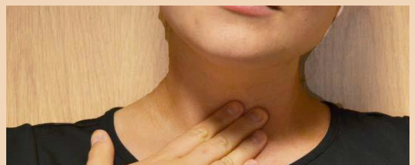
Problemau wrth lyncu