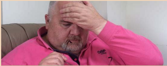
Pen tost difrifol

Os oes gennych haint ac rydych yn datblygu unrhyw un o'r symptomau isod, dylech gael eich gweld gan feddyg ar frys . Ffoniwch eich meddygfa neu NHS 111 neu NHS 24 .