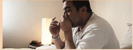
Çok daha kötü hissetme