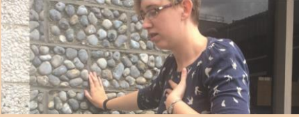
Nefes almada güçlük