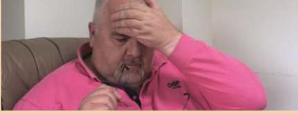
Şiddetli baş ağrısı

Eğer bir enfeksiyonunuz varsa ve aşağıdaki semptomlardan herhangi biri geliyorsa derhal bir doktora görünmelisiniz . Aile Hekiminizi, NHS 11'i, NHS Galler Direk Hattını ya da NHS 24'ü arayın.