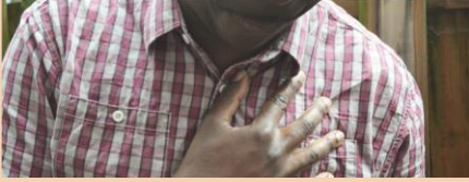
Göğüs kafesinde ağrı