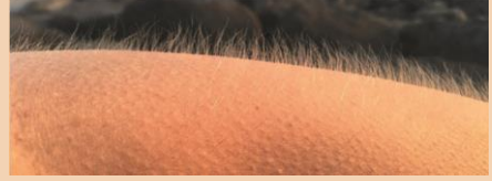
Çok soğuk cilt