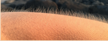
جلد شديد البرودة

إذا كنت مصابًا بعدوى وتطورت لديك أي من الأعراض التالية، يجب أن يفحصك الطبيب في الحال. اتصل بعيادة الممارس العام أو اتصل على NHS 111 أو NHS Direct Wales أو NHS 24 .