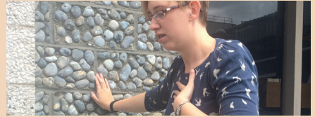
صعوبة في التنفس