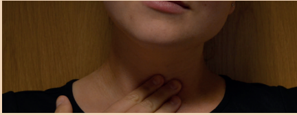
مشاكل في البلع