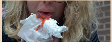
سعال مصحوب بالدم