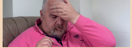
شدید سر درد