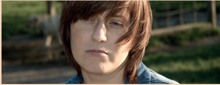
الجھن محسوس کرنا