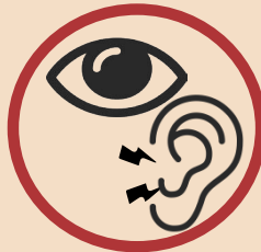
Pigyn clust neu haint llygad