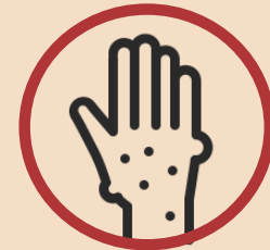
Haint ar y croen

I gyrchu taflenni gwybodaeth i gleifion gyda chynngor ar heintiau cyffredin, sganwch y QR neu ewch i: